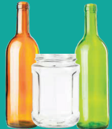
Botellas de vidrio vacías, frascos (sin tapas)