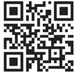
Mapa de Arrecifes Artificiales

El condado Pinellas reutiliza elementos seguros para el medio ambiente, como hormigón, tuberías y vigas de acero, para construir arrecifes artificiales. Actualmente, hay 43 arrecifes artificiales en el condado: 14 en alta mar y 29 en la costa. Los arrecifes artificiales brindan un hábitat valioso para la vida marina y crean atracciones emocionantes para que los buceadores exploren. Puede encontrar todas las ubicaciones de los arrecifes en nuestro mapa en línea visitando Pinellas.gov/reef o escaneando este código QR.