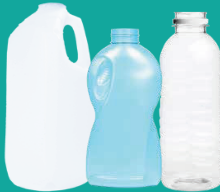
Botellas de plástico vacías, jarras (sin tapas)