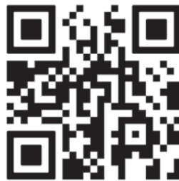
Sitios de recolección de mantillo

En el condado Pinellas se trituran los desechos del jardín y se convierten en mantillo para que los residentes los reutilicen. El condado Pinellas ofrece mantillo gratis en lugares convenientes, solo traiga una pala y un contenedor de transporte y tome todo lo que necesite. ¡Su jardín se lo agradecerá! Para obtener más información, visite Pinellas.gov/mulch o escanee este código QR para obtener un mapa en línea de los sitios de recolección de mantillo.