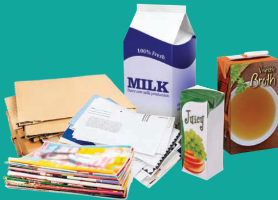
Cartón aplanado, papel limpio, correo desechable, cartón

Coloque solamente estos artículos en el contenedor de reciclaje. Todo limpio y seco. No se permiten bolsas de plástico. No se permite reciclar en bolsas.