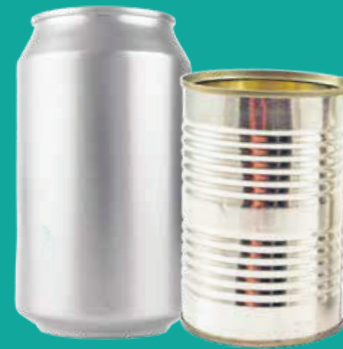
Latas de metal vacías (sin tapas)